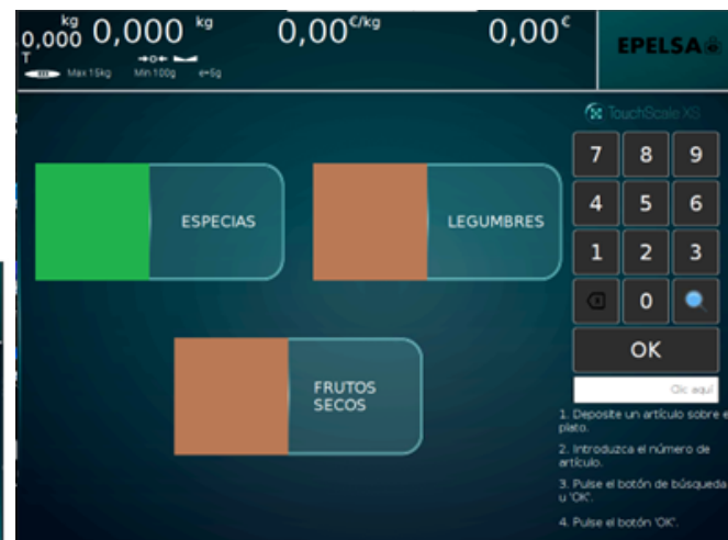
Familias y selección de Artículo