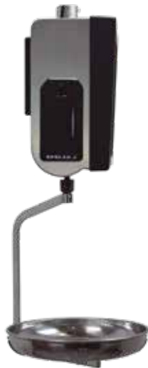
Pantalla trasera de 9"

Gracias a la conexión a Internet mediante USB a móvil, la balanza puede operar de forma totalmente autónoma incluso en ubicaciones sin red Ethernet o Wi-Fi.