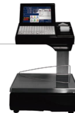
20 I - Impresora