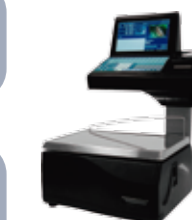
20 RL - Etiq.