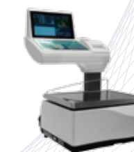
20 RLI - Etiq. + Impr.