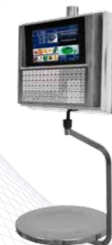
22 RL - Etiq.