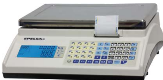
Marte 10 V4 IC

Balanza sobre mostrador, etiquetadora, especial para trabajo en self-service.