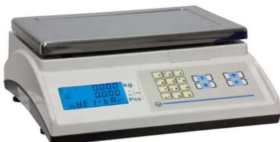
Marte 10 MF

La gama de balanzas Marte de GRUPO EPELSA está formada por una gran variedad de equipos que se muestran a continuación: