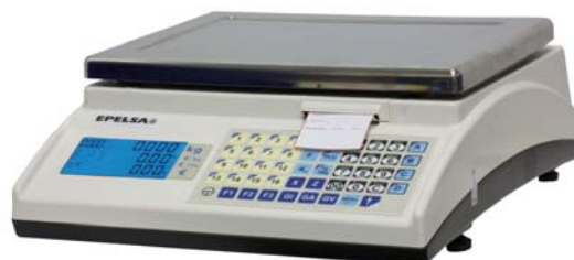
Marte 10 V4 ILC

Balanza sobre mostrador, cuatro vendedores, impresora, interconectada.