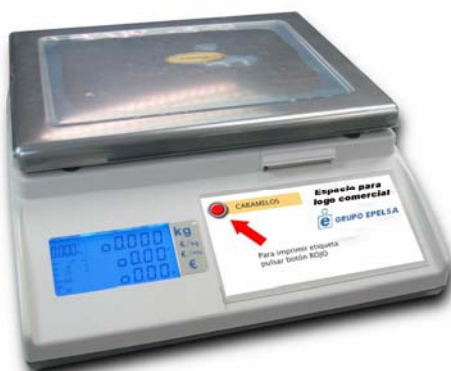
Marte ILC 1T

Balanza sobre mostrador, cuatro vendedores