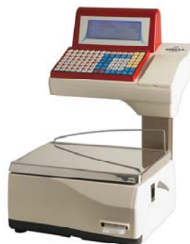
Júpiter 20 RL

Balanza sobre mostrador, doble cuerpo, etiquetadora