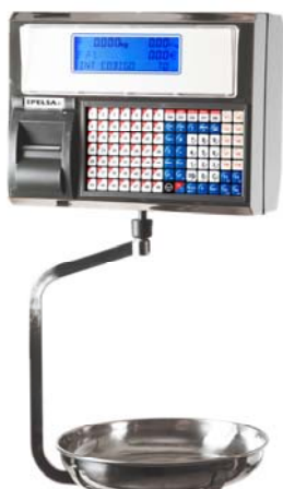
Júpiter 22 V10

Balanza sobre mostrador, doble cuerpo, etiquetadora