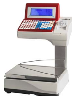
Júpiter 20 V10

Balanza sobre mostrador, doble cuerpo, impresora