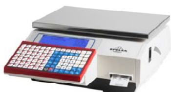
Júpiter 10 RL

Balanza sobre mostrador, doble cuerpo, impresora