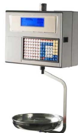
Júpiter 22 RL