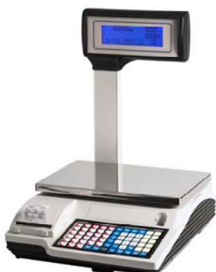
Júpiter 11 V10

La gama de balanzas Júpiter de GRUPO EPELSA está formada por una gran variedad de equipos que se muestran a continuación: