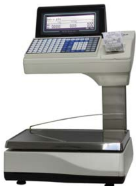
Euroscale 20 V14 98T

La gama de balanzas Euroscale de GRUPO EPELSA está formada por una gran variedad de equipos que se muestran a continuación: