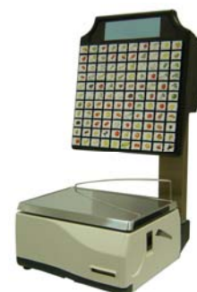
Euroscale 20 SS 110T