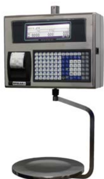
Euroscale 22 RLI Inox 98T

Balanza sobre mostrador, doble cuerpo, etiquetadora