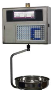
Euroscale 22 RL Inox 98T