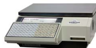
Euroscale 20 RLSS ABS 98T

Balanza sobre mostrador, doble cuerpo, impresora y etiquetadora