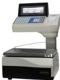
Euroscale 20 RLI 98T

Balanza colgante, impresora y etiquetadora