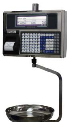
Euroscale 22 V14 Inox 98T

Balanza sobre mostrador, doble cuerpo, impresora