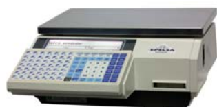
Euroscale 20 RLP ABS 98T

Balanza sobre mostrador, etiquetadora, venta asistida